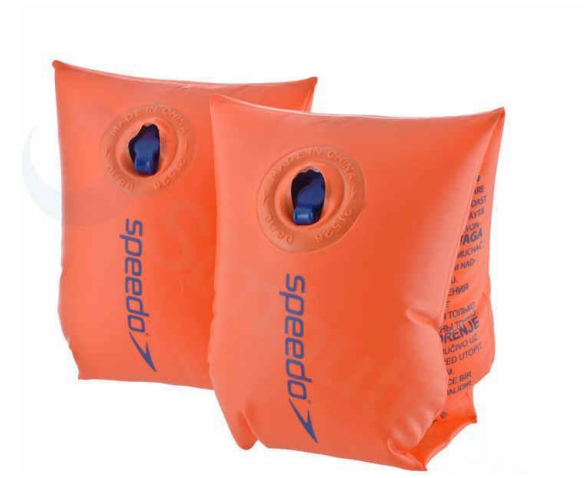
Jag är armpuffarna