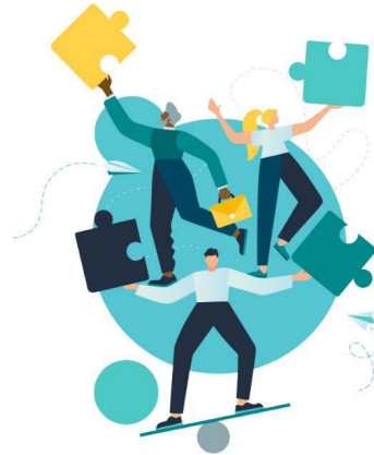
Projektledare för 'Projekt Mamma'